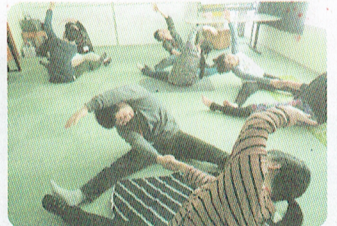
▲パートナーヨガ体験講座